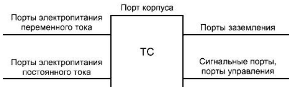
Рисунок 1 - Примеры портов ТС